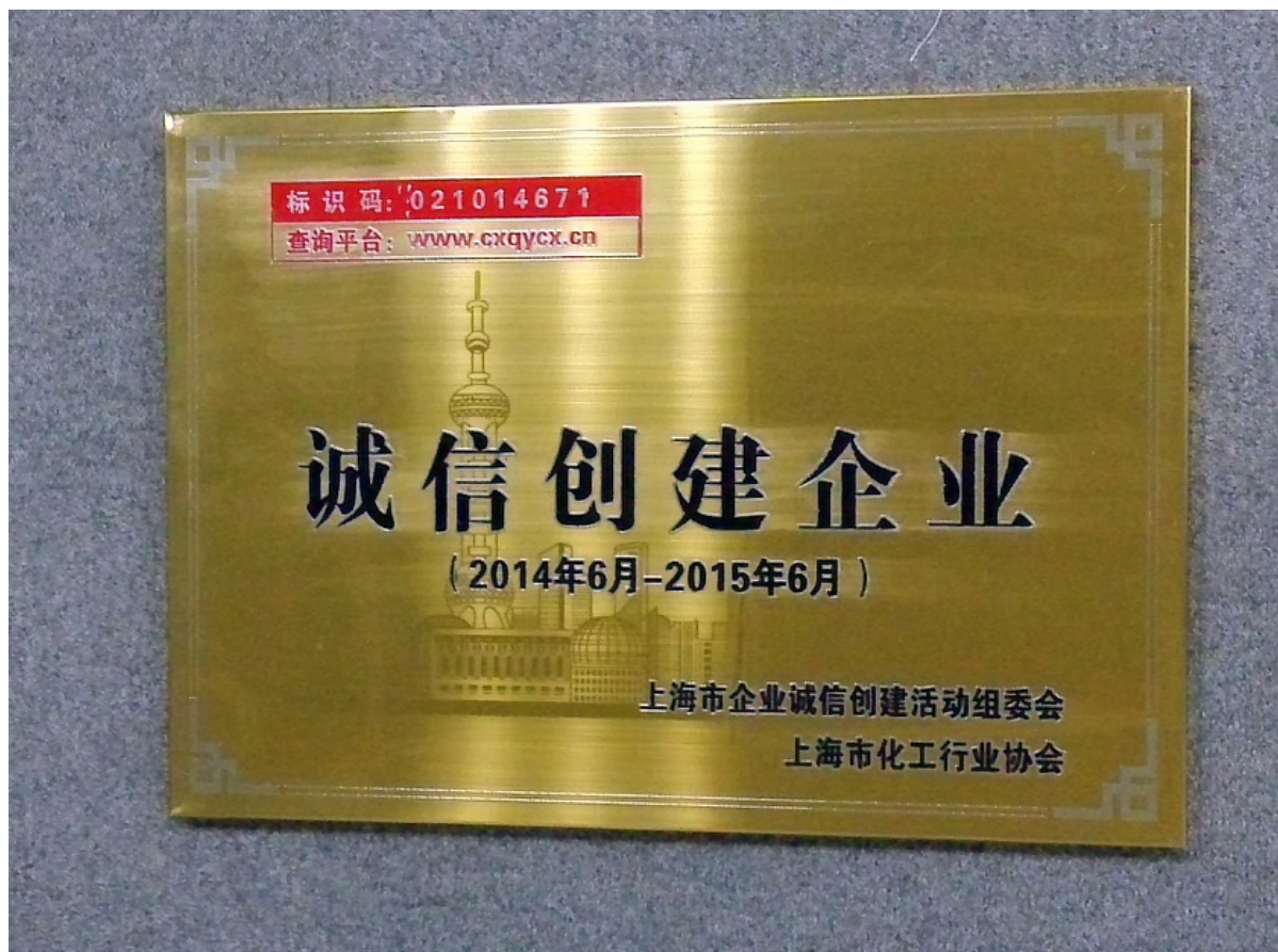
圖片一：葉氏化工榮獲「誠信創建企業」銅牌及獎狀